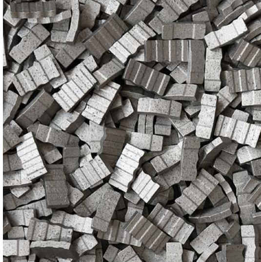
▲ Алмазные сегменты для ремонта коронки