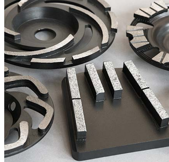
▲ Шлифовальные чашки и фрезы