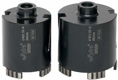
Алмазные коронки для сверления железобетона