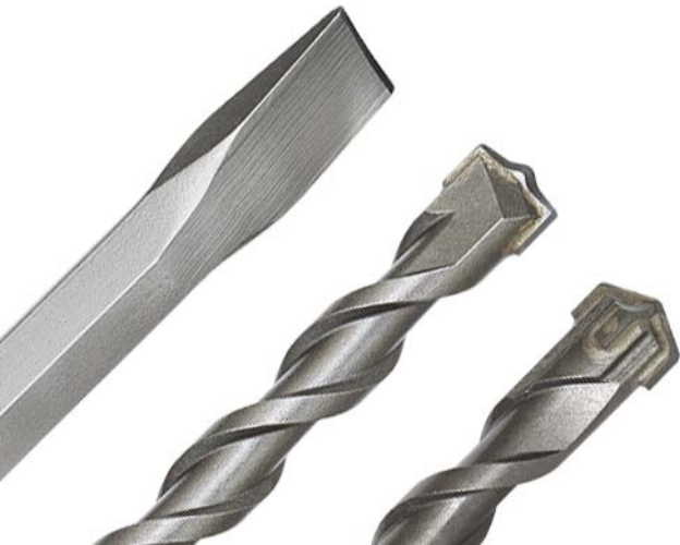
◀ Долота и буры