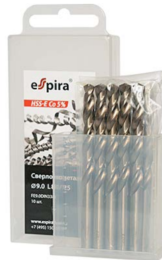
▲ Сверла по металлу